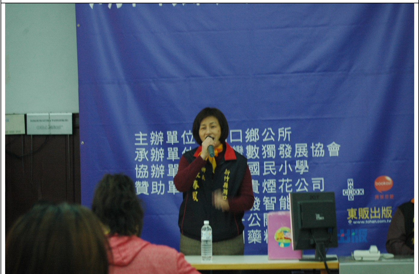
張鄉長主持閉幕式，進行致詞