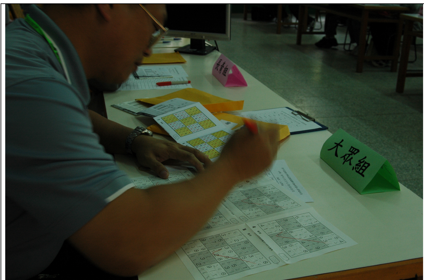
裁判現場即時改題，評審出前十名優勝者。