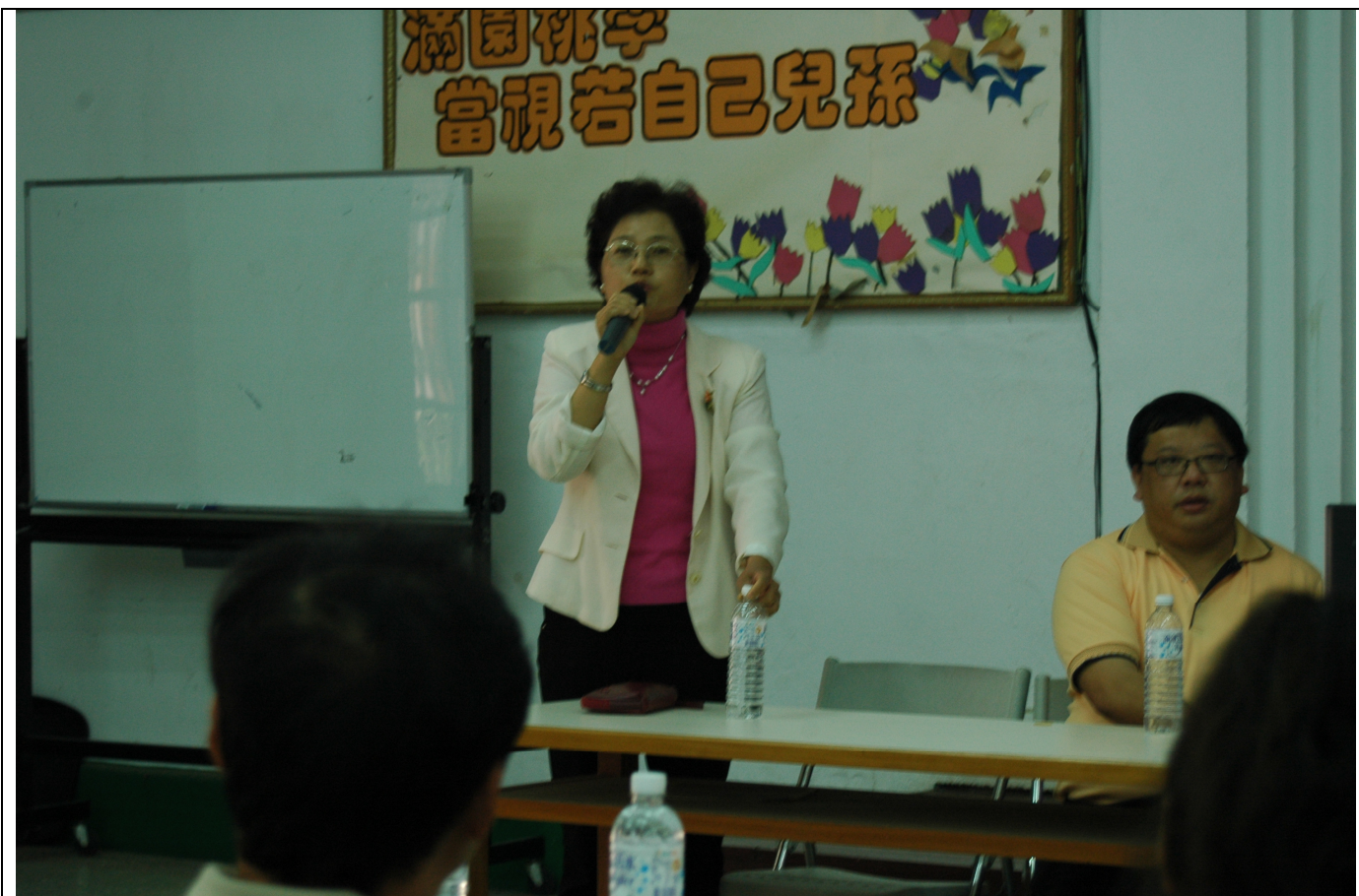
湖口圖書館張館長為大會致詞並頒獎