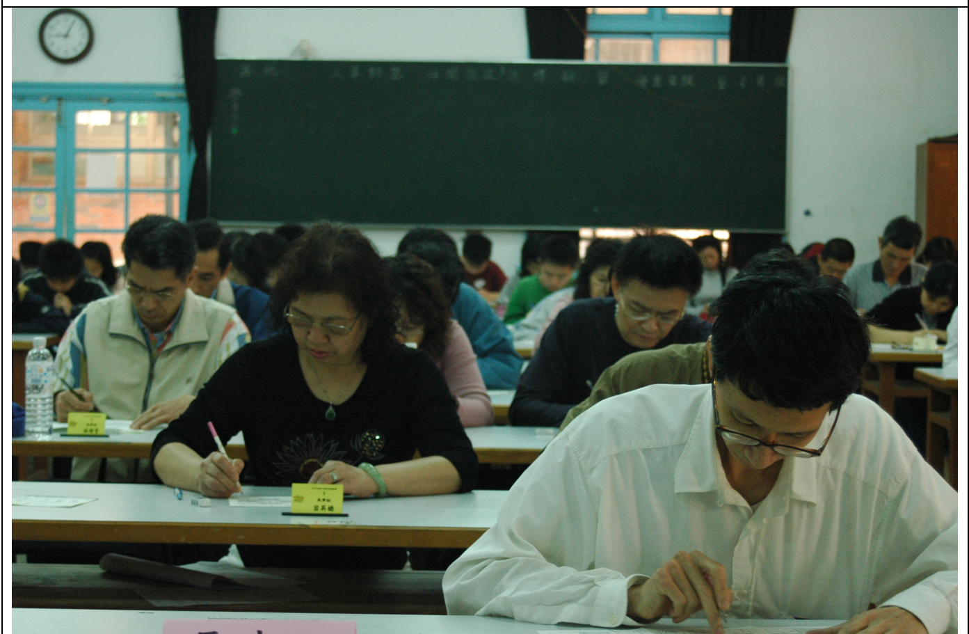
長青組的比賽選手們也是心無二想