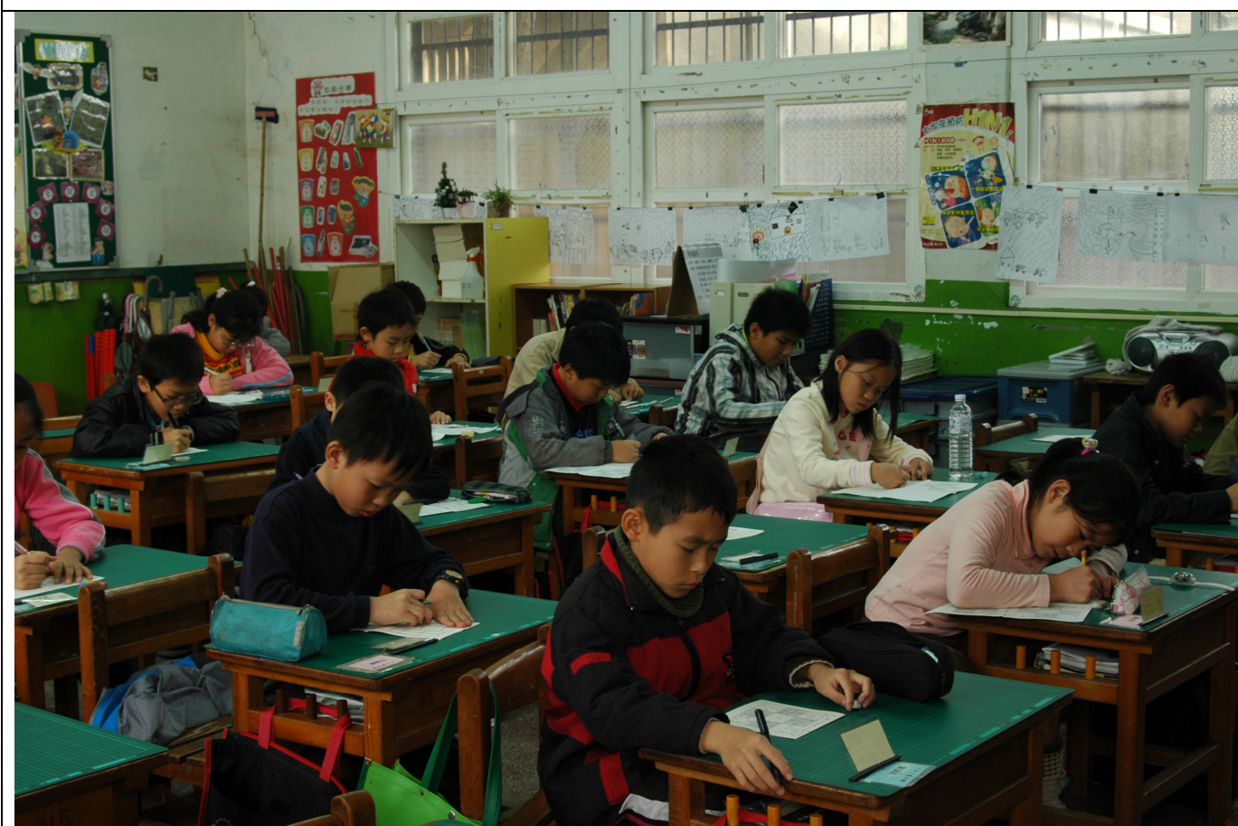
比賽開始了，大家聚精會神進行解題