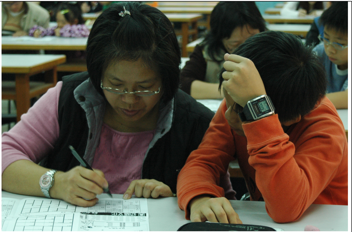
親子組比賽策略之一---由一人主筆