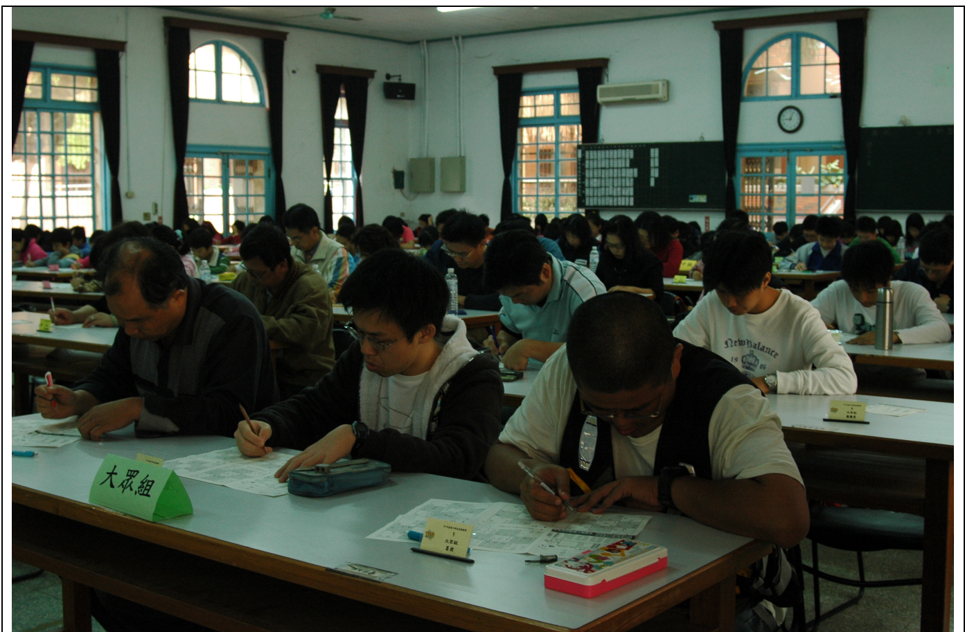
比賽主場地—禮堂中的比賽情況