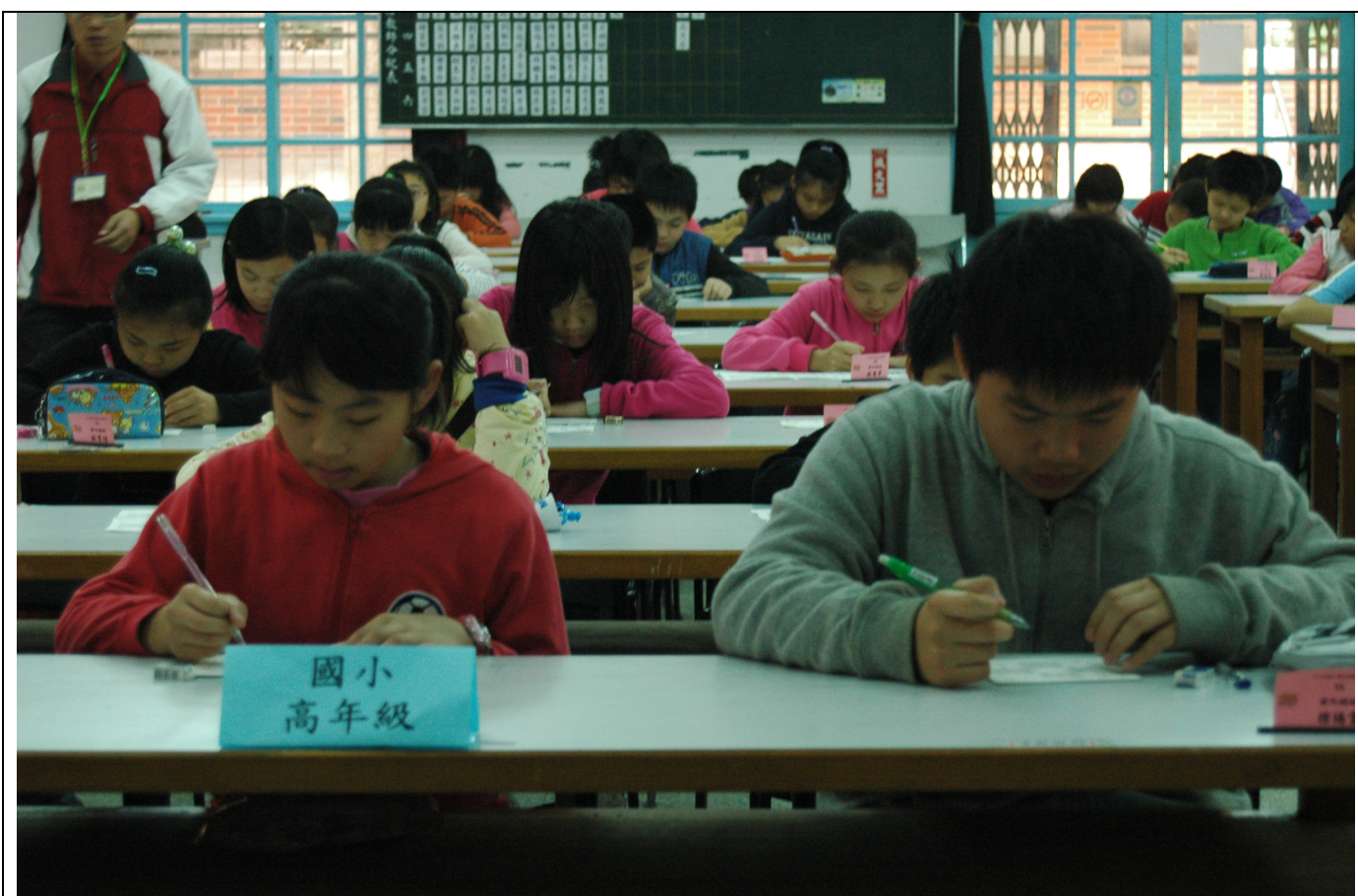
參賽人數最多的國小高年級組，共有 90 人參賽。