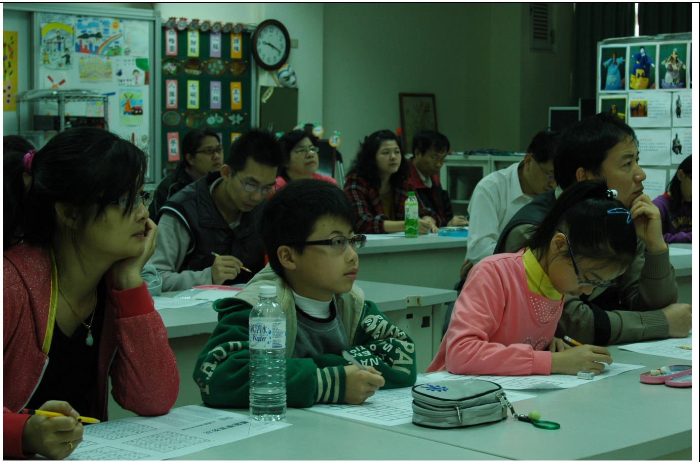
看！參加體驗學習活動的民眾多麼專心聆聽學習