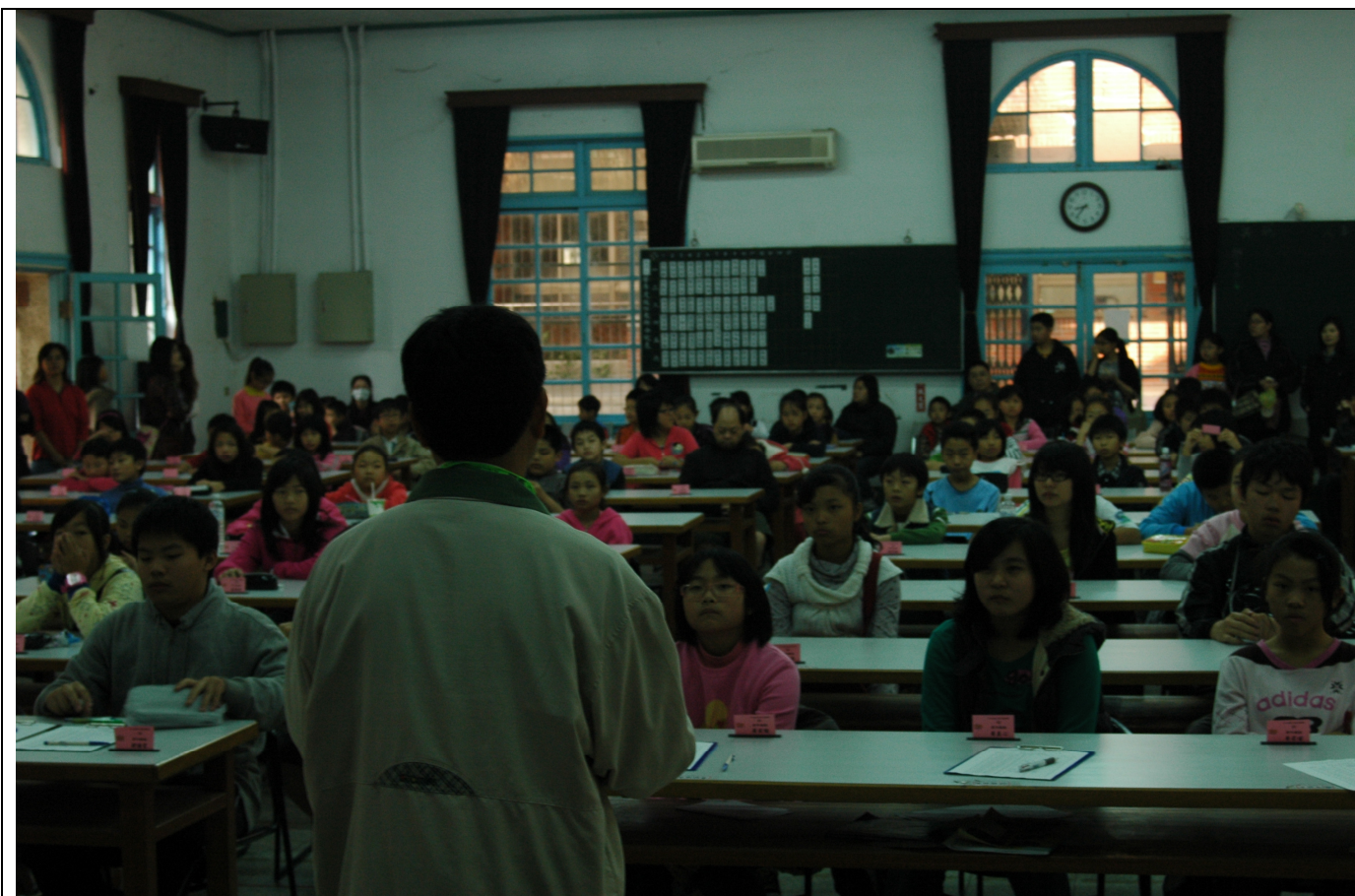
開幕的人氣已十分充沛，座無虛席。