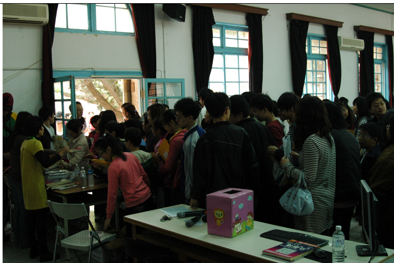
活動結束，大家離場時領取紀念品—數獨 365 及 Linuxpilot 各一本