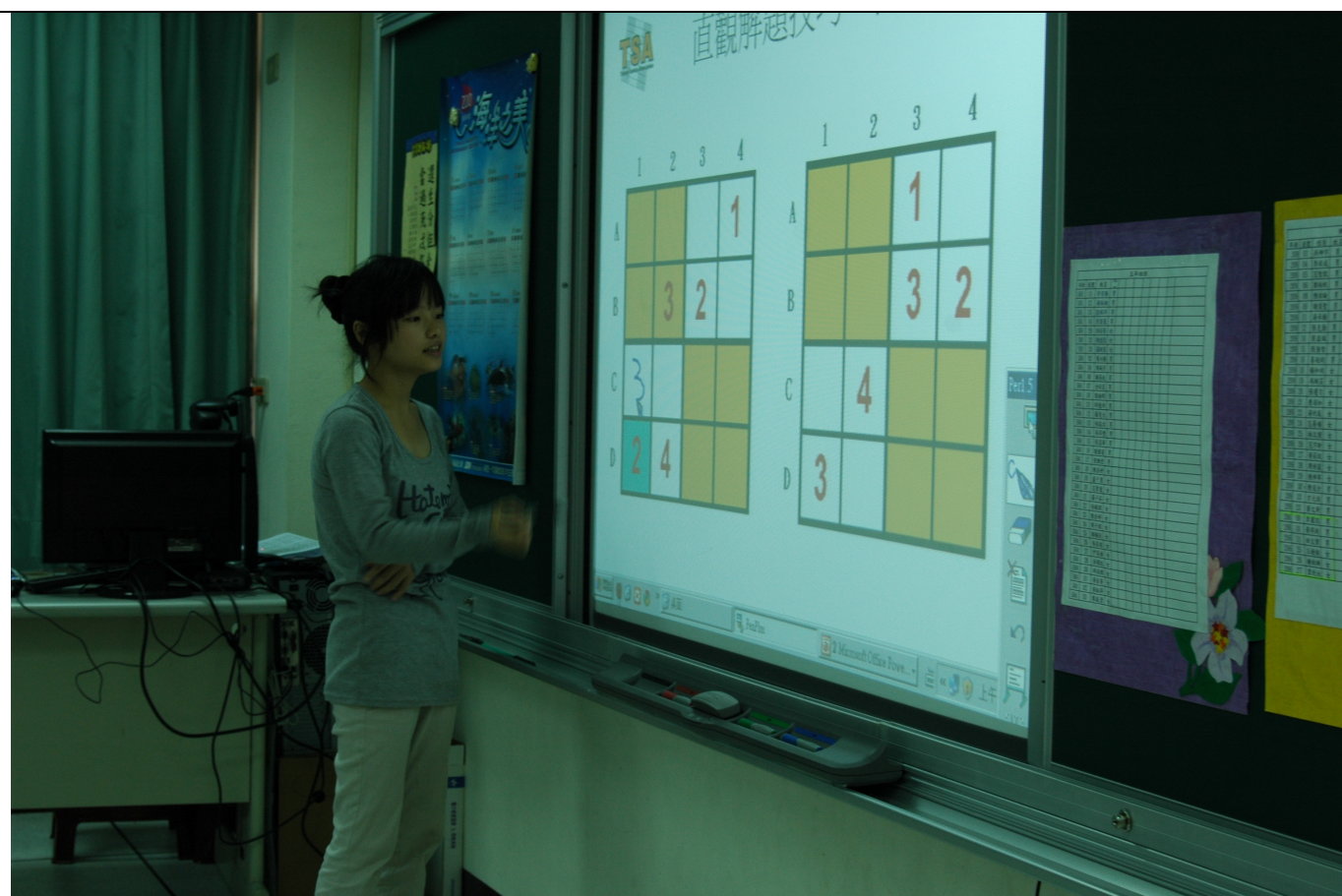
和比賽同時進行的體驗學習活動，提供給不懂數獨者學習、入門的機會