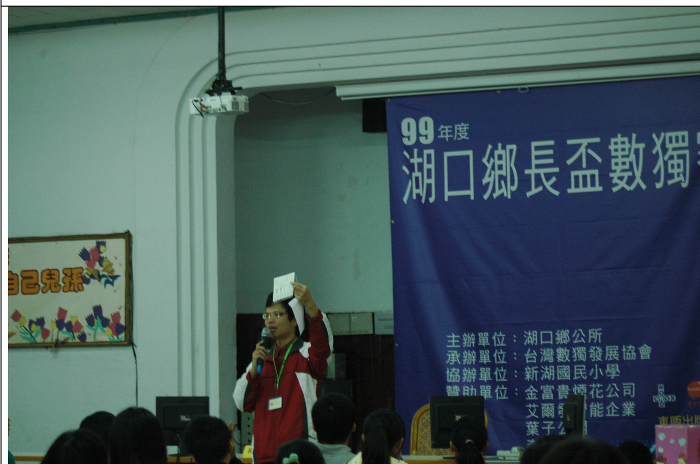
評審長說明比賽規則及注意事項