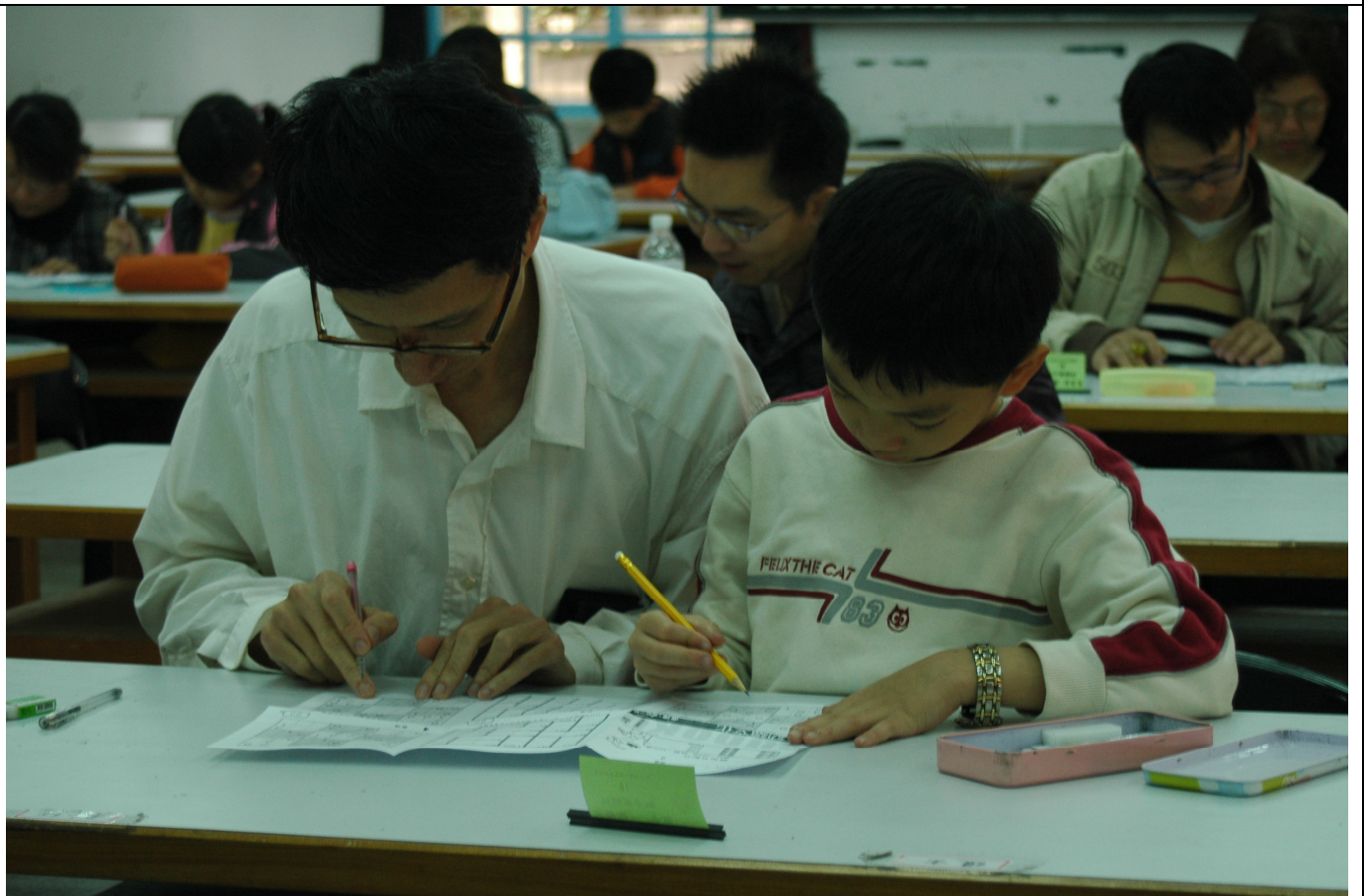
親子組比賽策略之二---由二人分工合作