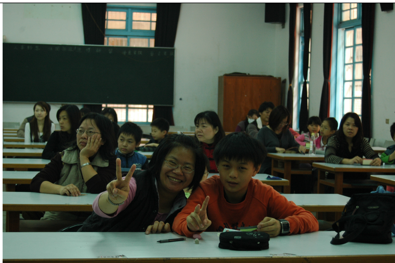
親子組一共有 35 組參加，比賽即將開始，輕鬆一下吧！