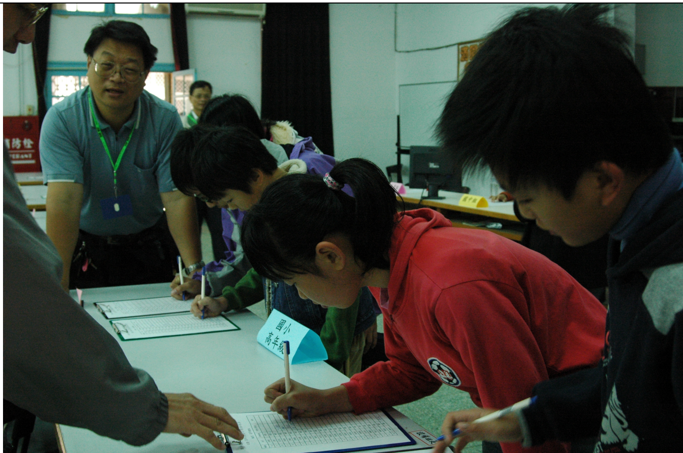
參加比賽的選手進行簽到