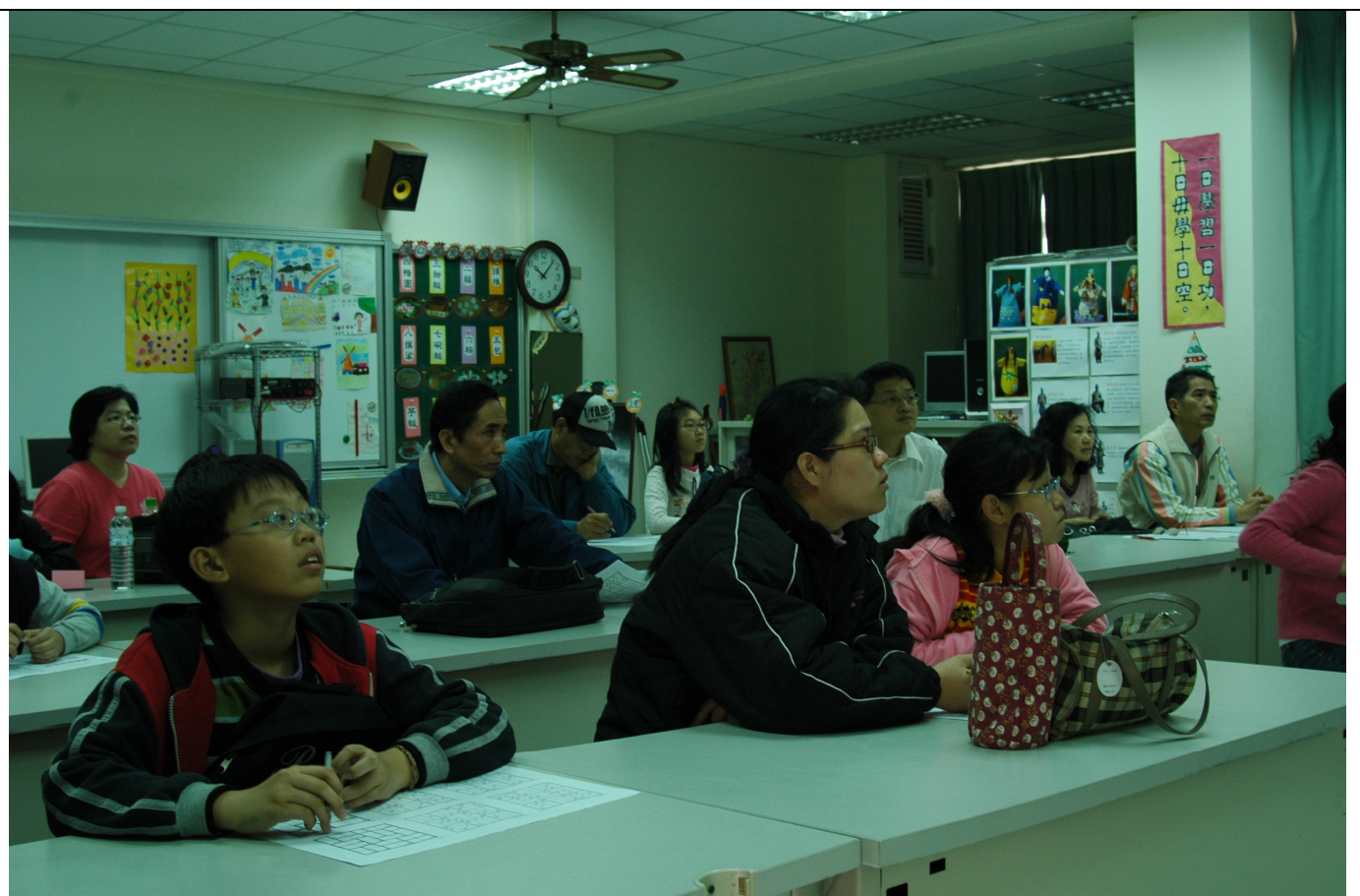
參加第二場體驗學習活動的民眾一樣十分踴躍