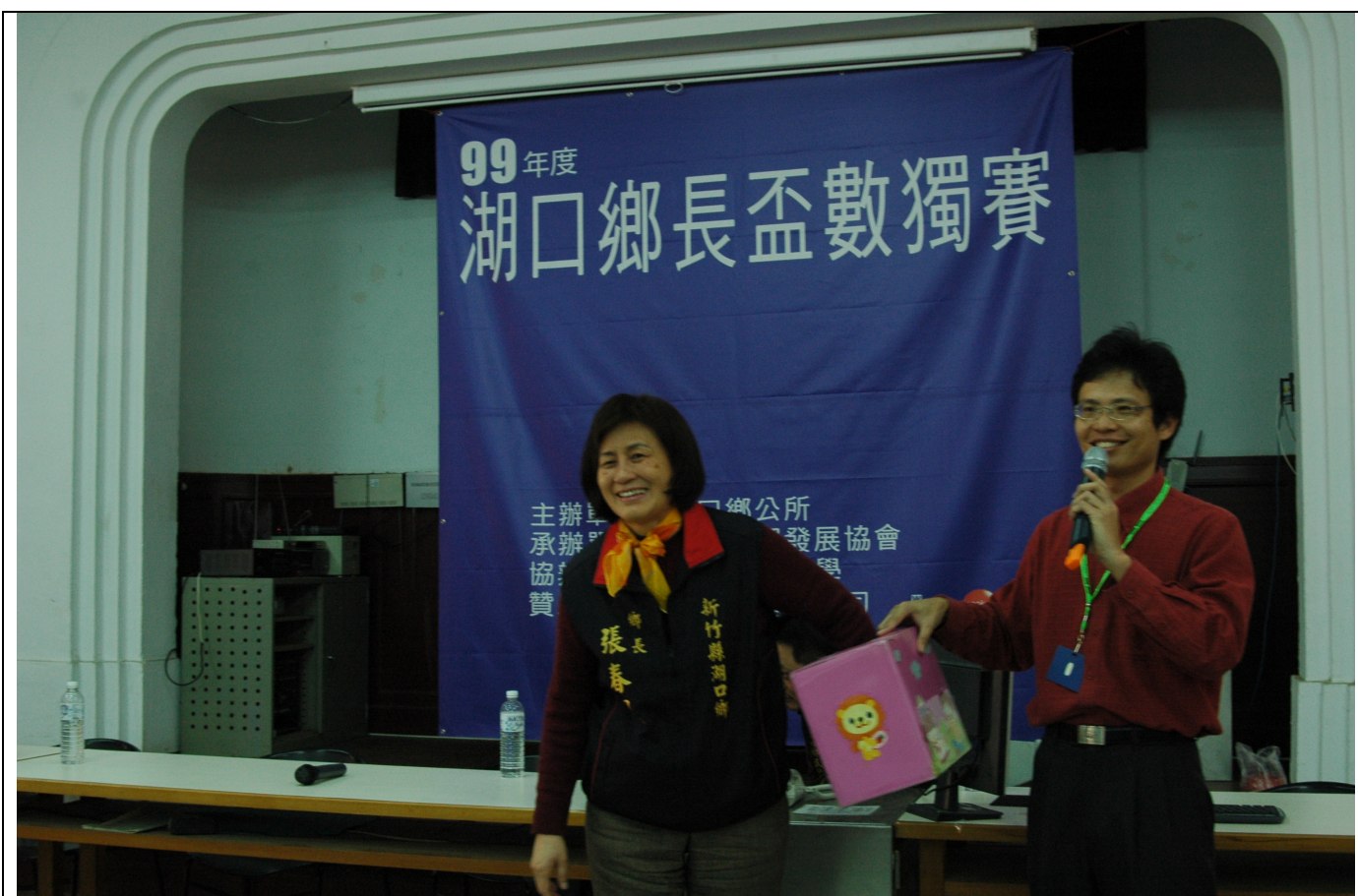
張鄉長為摸彩活動進行摸彩