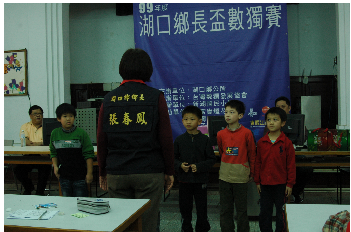
張鄉長為國小低年級組頒獎