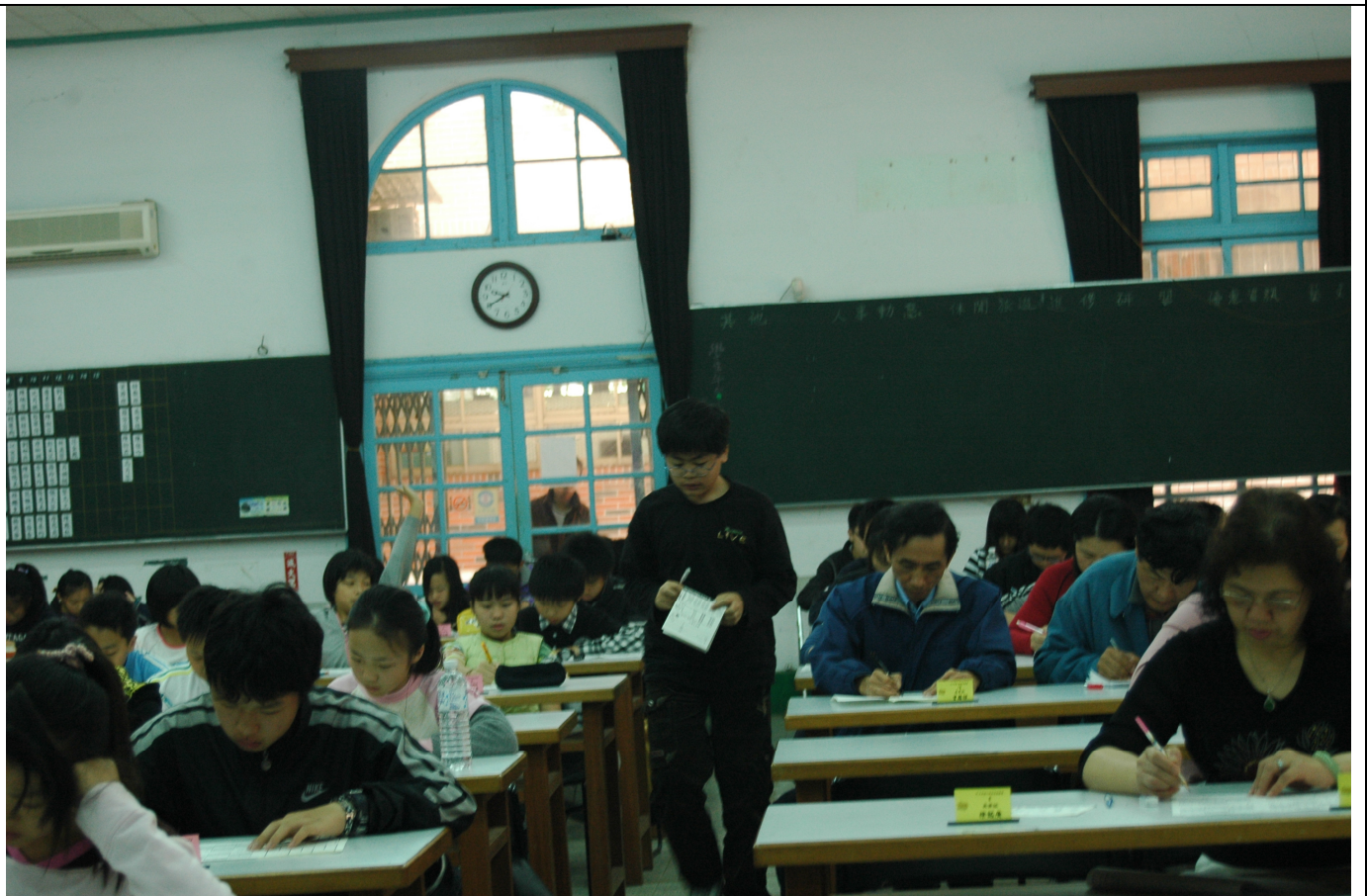
哇！有人完成解題繳卷了，恭喜，只要完全正確，優勝者就是我囉！