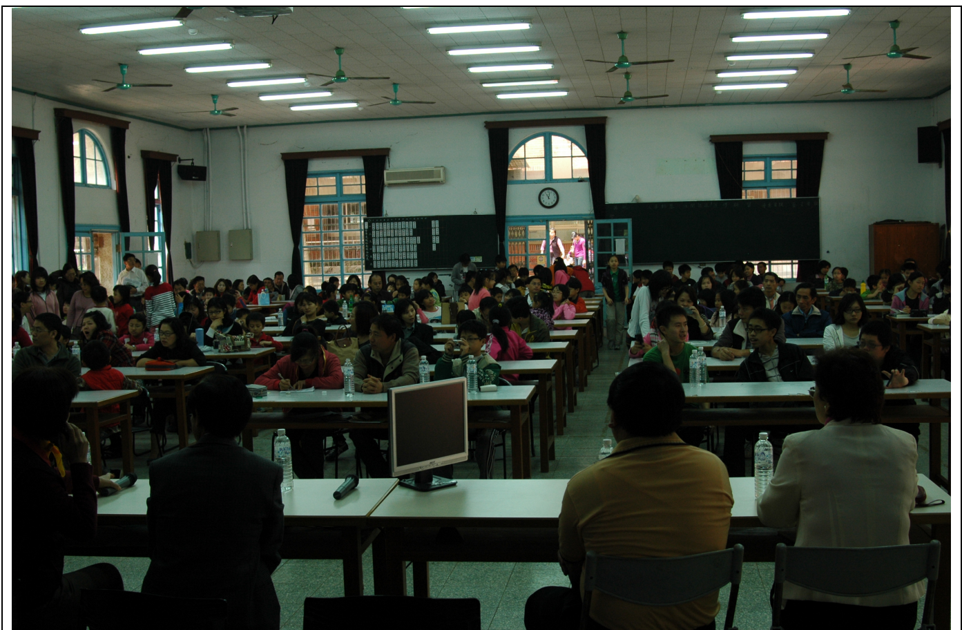
參加閉幕典禮的民眾更為踴躍