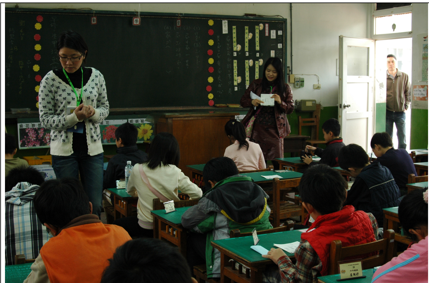
國小中年級組比賽場地裁判賽前提示